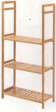
④ 取出三层层板以及螺丝, 如图安装