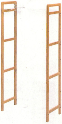
① 取出侧边支架2片 (如图所示)