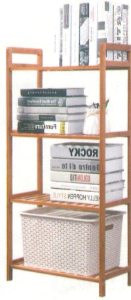
⑥ 安装步骤是不是很简单呀! ? 可以当书架、花架、鞋架、置物架等