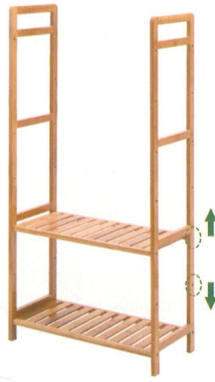
③ 取出二层层板以及螺丝如图安装 (预留孔位层板上下可自由调节)