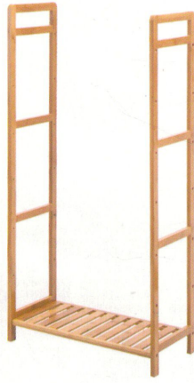
② 取出一层层板以及螺丝, 如图安装